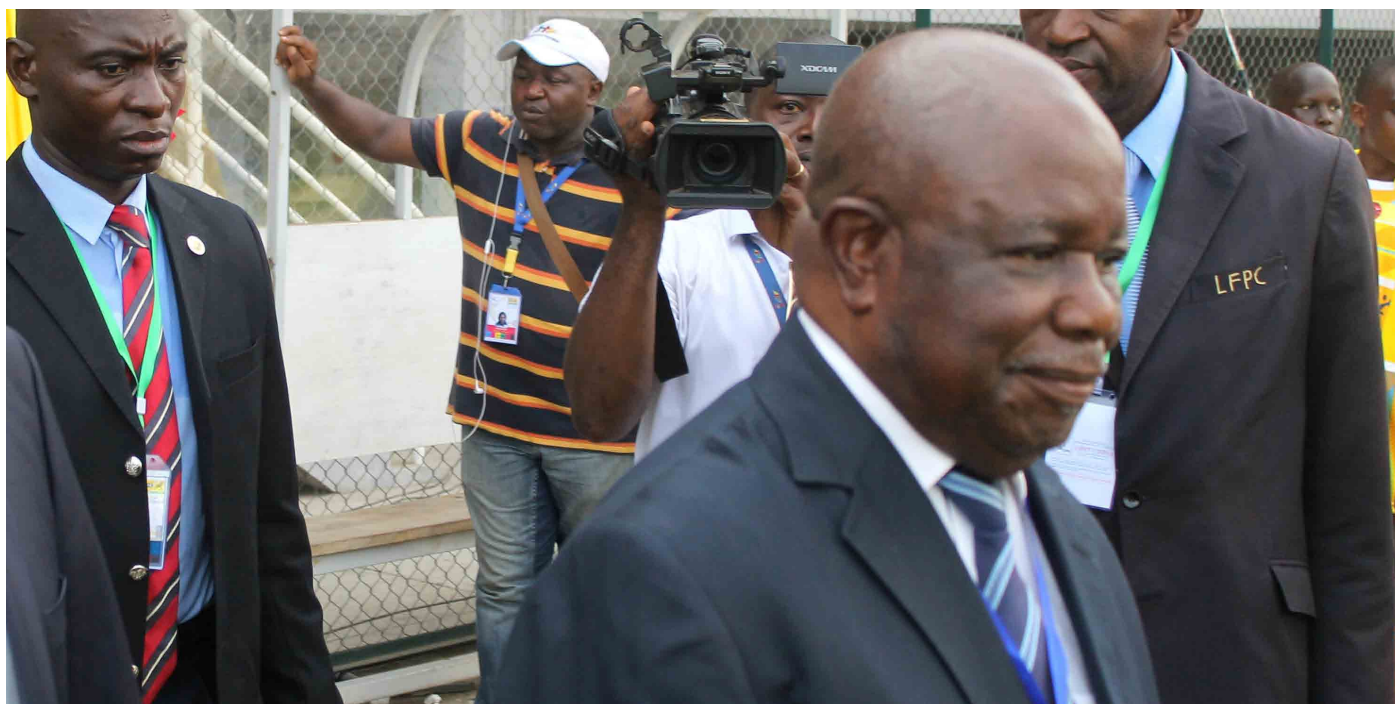
Le Général Pierre Semengue lors de l'ouverture de la précédente saison