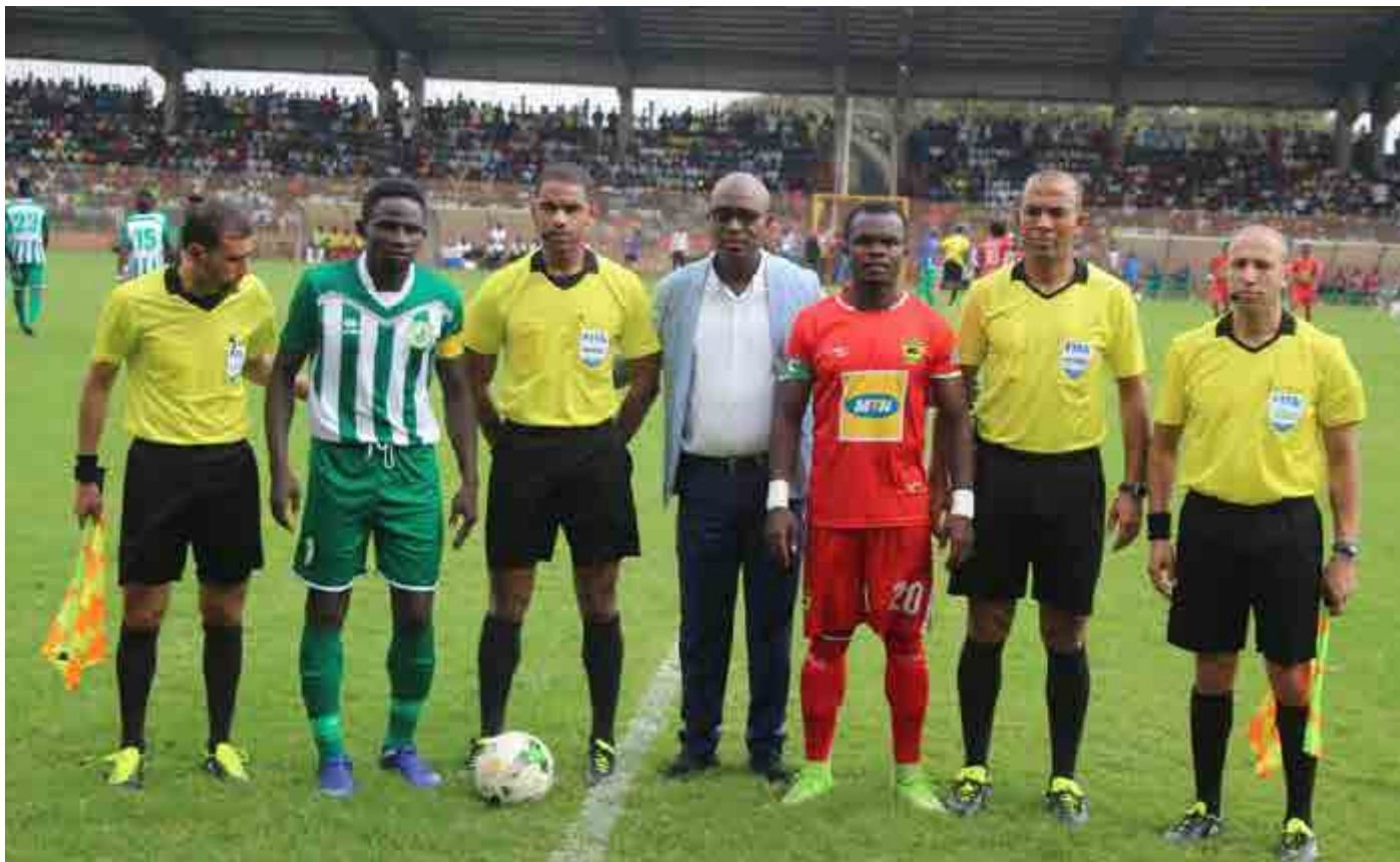
Match aller entre Coton Sport et Asante Kotoko au Stade militaire de Yaoundé

Coton sport de Garoua et New stars de Douala sont prêts à tout pour se hisser en phase de poule de la coupe de la confédération. En effet, leurs dirigeants s'engagent à verser de juteuses primes à leurs joueurs en cas de qualification ce dimanche.